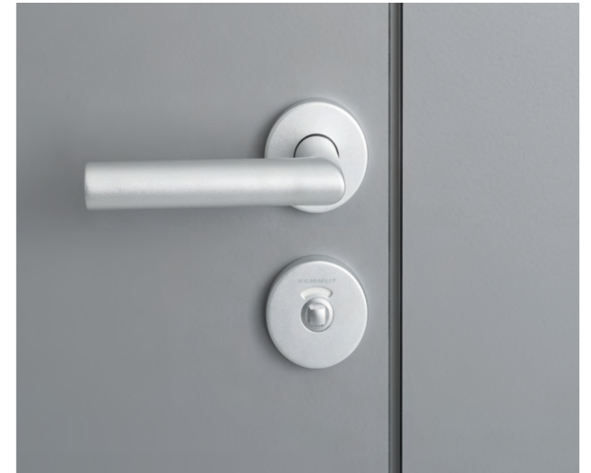
Aluminium-Drückergarnitur mit Schauscheibe