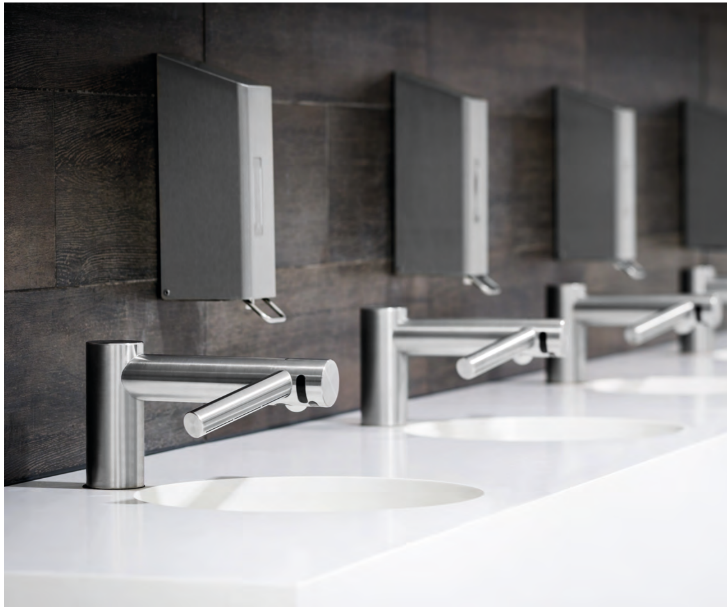
Dyson Händetrockner Wasch+Dry, Armatur und Händetrockner in einem