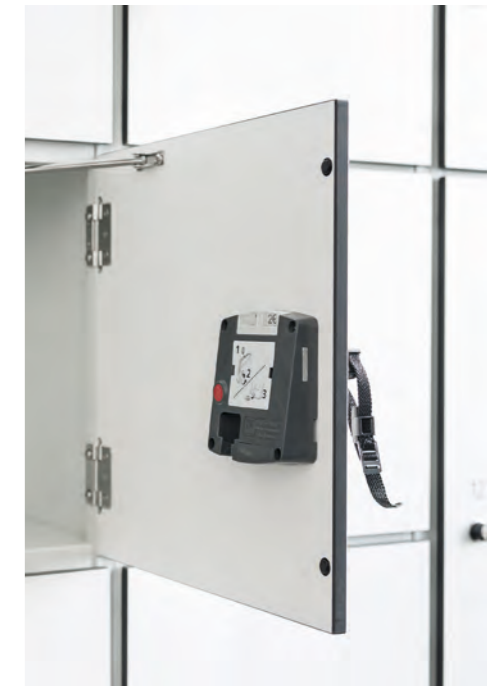
Schließfach TYPO S mit Stahlkorpus und HPL-Tür