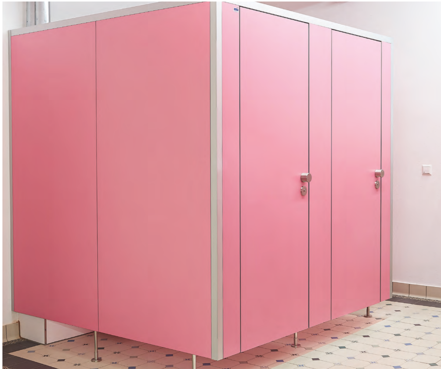
PRIMO Kn in der Sonderfarbe U17014 VV Hortensie, eingebaut in der Jakobsschule Stuttgart