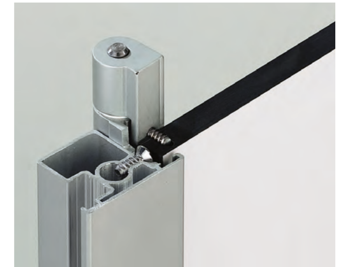
cronus massive Verschraubung