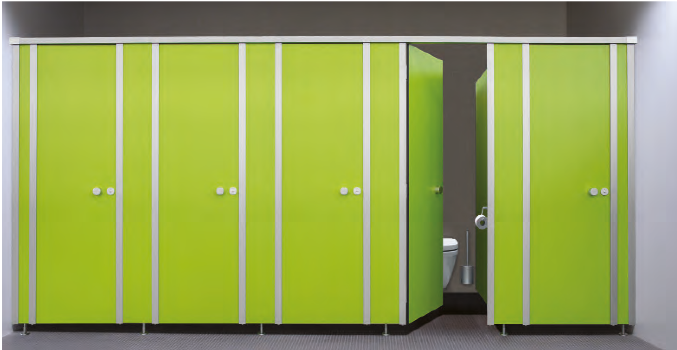
cronus standoptimiert in reinigungsfreundlicher Ausführung mit zurückgesetzten Füßen, in Limonengrün 6715