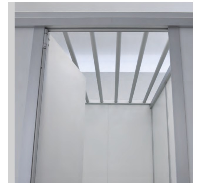
cronus Übersteigschutz aus Aluminium