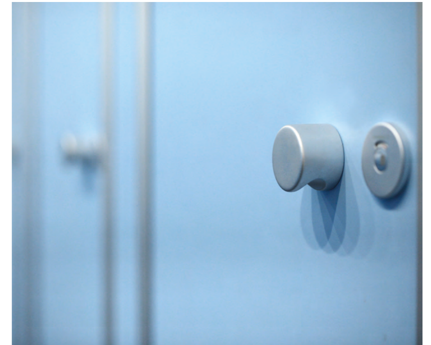
Aluminium-Zugknopf mit Schauscheibe