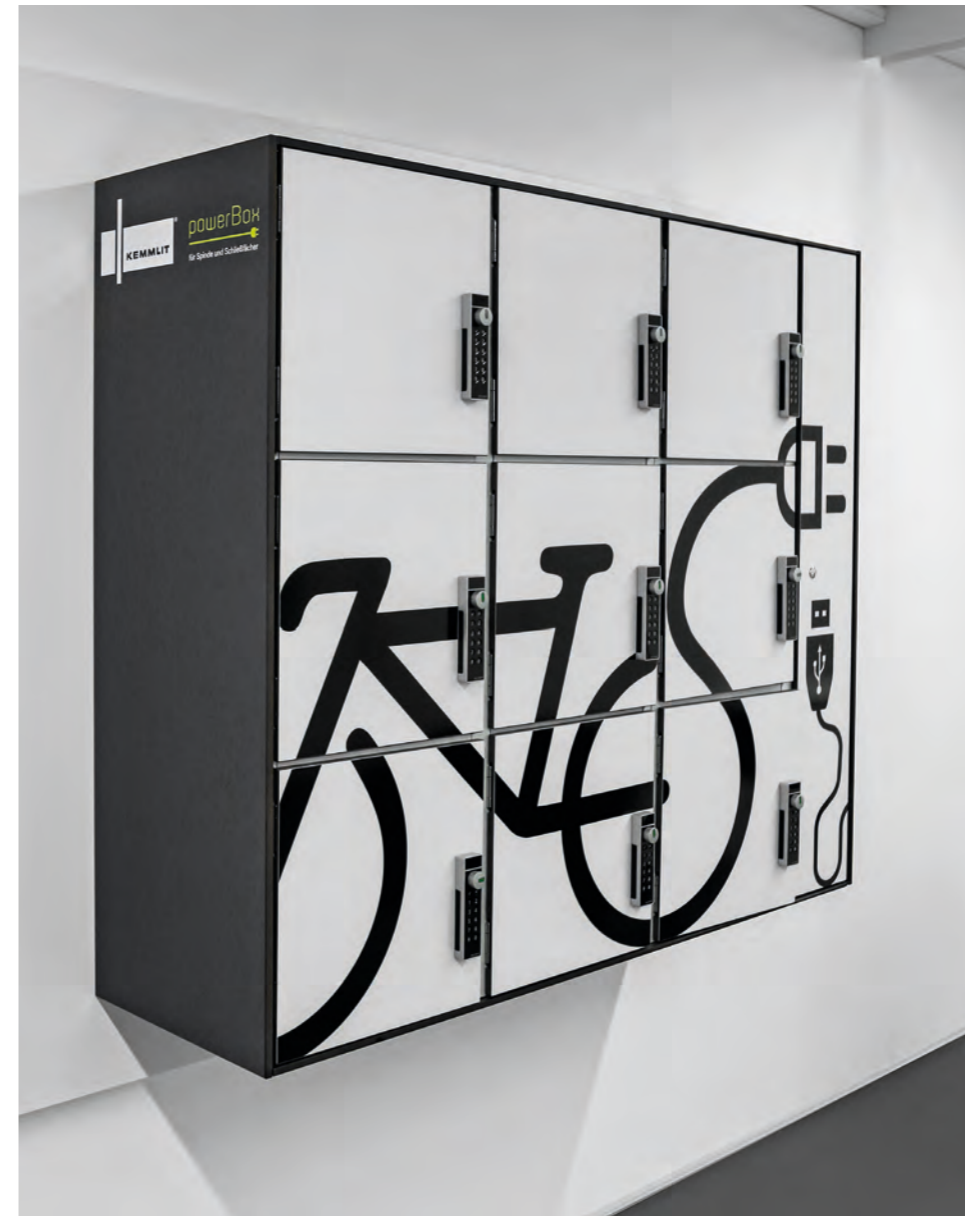
powerBox Schließfächer mit Strom im Schließfach zum Laden von e-Bike Akkus und Smartphone