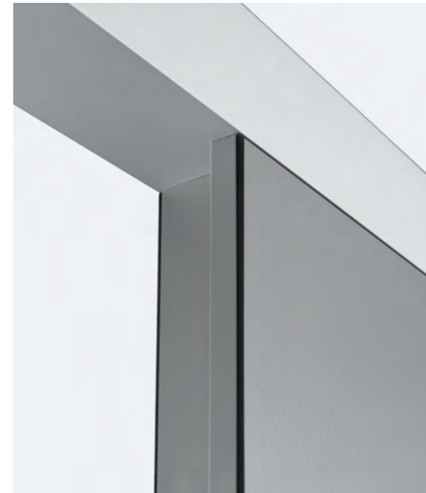
Stabilisator aus Aluminium