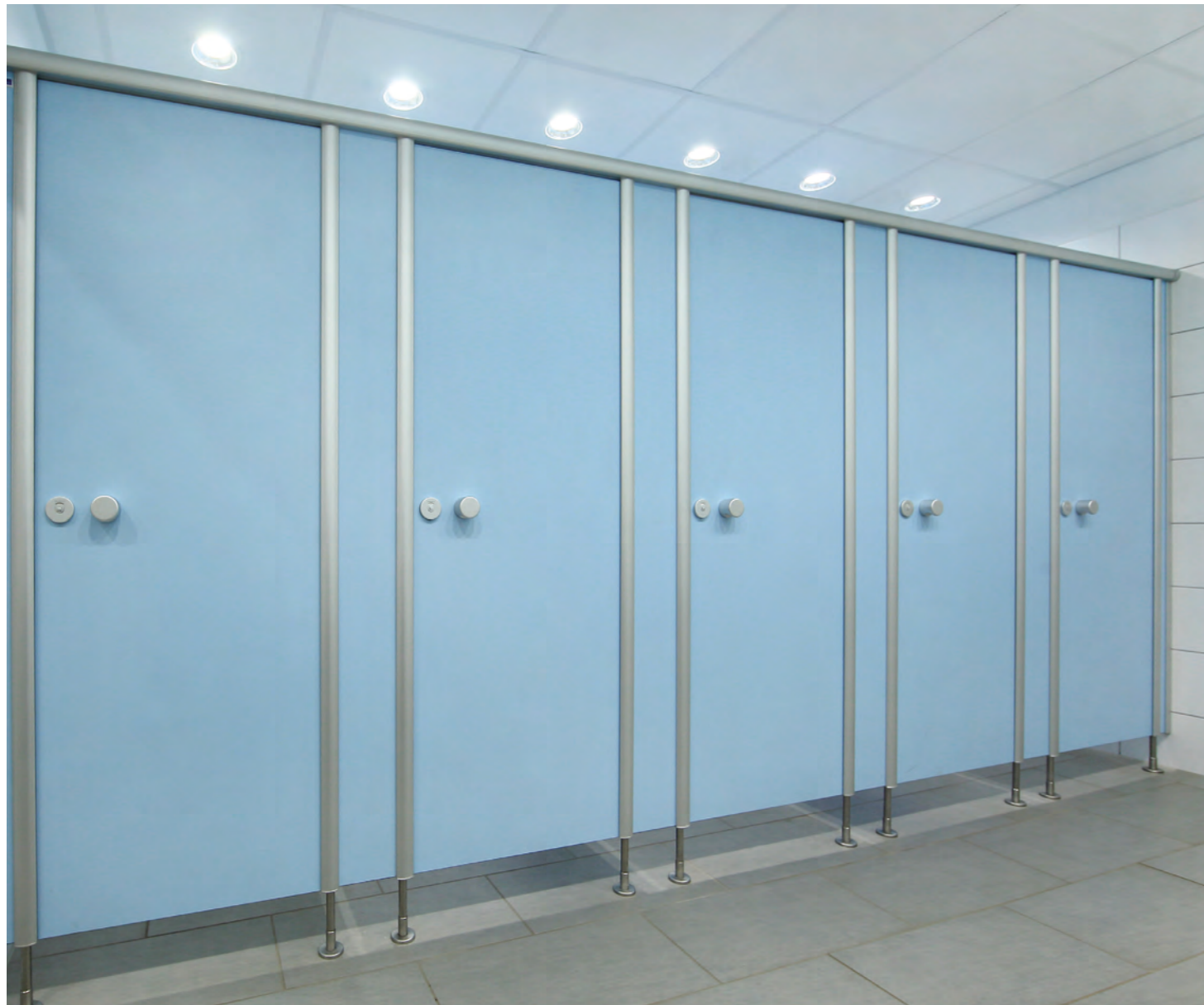
WC-Kabine BASIC Typ C in Lagunblau 5408