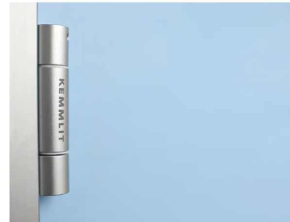
BASIC Typ C Drei-Rollen-Kantenband