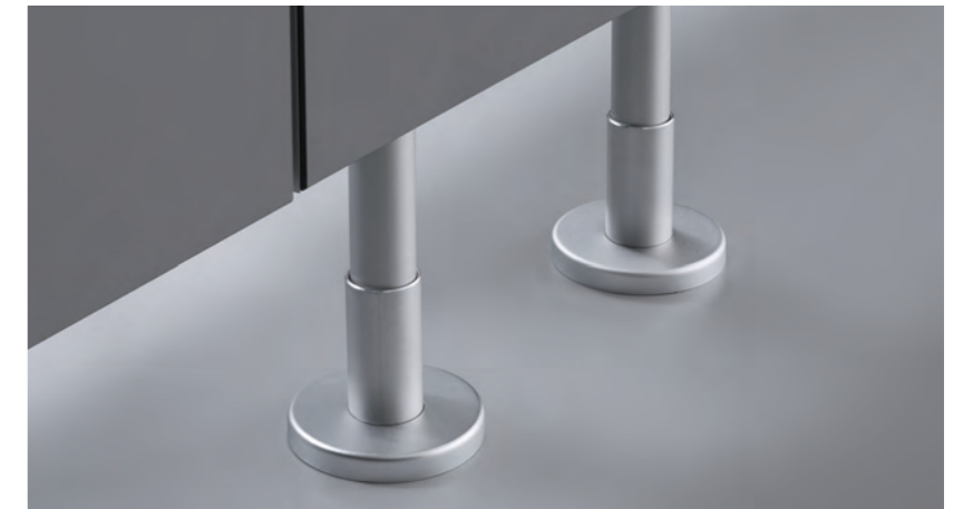
Aluminium-Aufschraubfüße mit Flachrosette