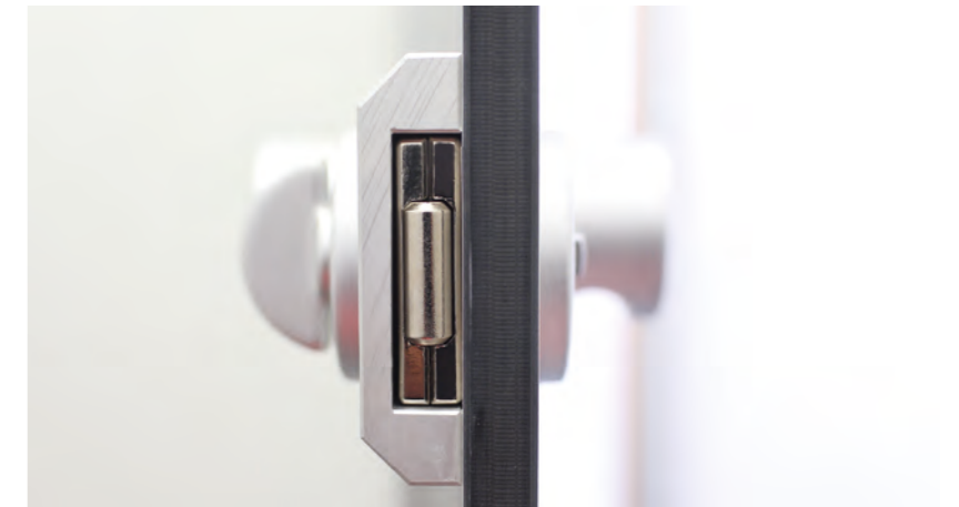
Aluminium-Schloßplatte mit robustem Schloss