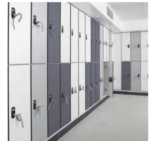
Spinde TYPO R mit Alu-Korpus und HPL-Tür