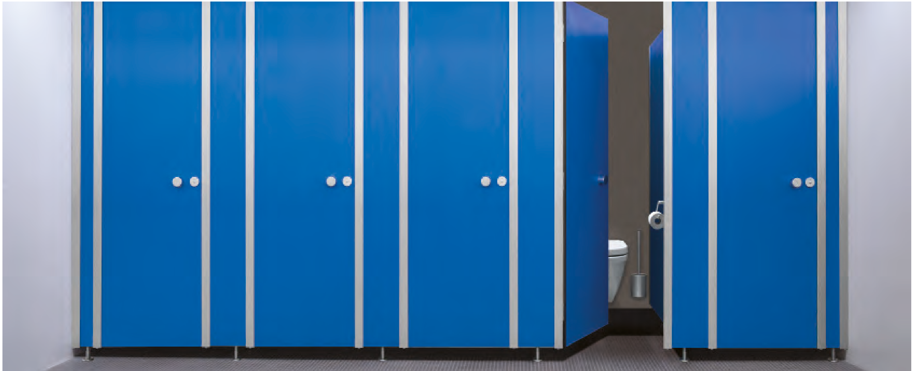
cronus standoptimiert in reinigungsfreundlicher Ausführung mit zurückgesetzten Füßen, in Pazifikblau 5715