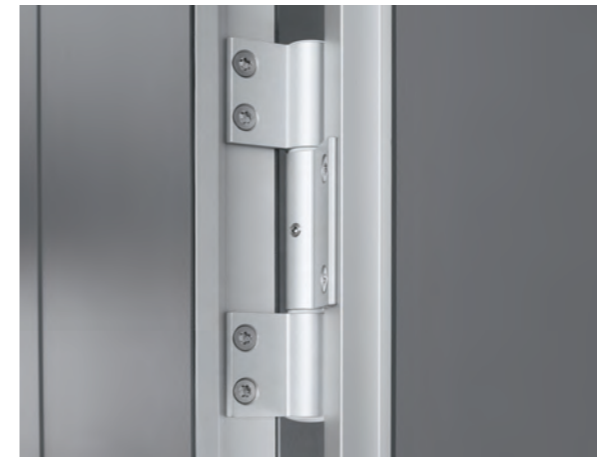
PRIMO Kn Drei-Rollen-Kantenband