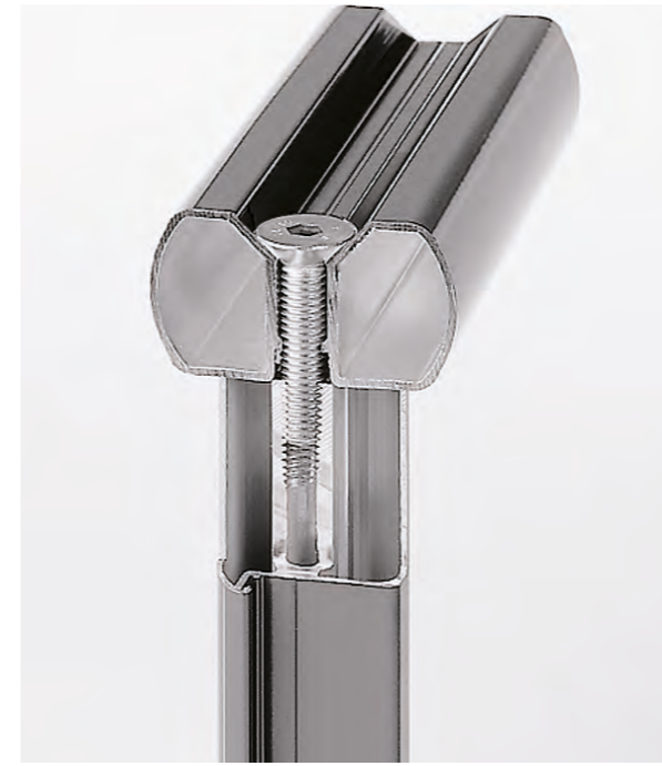
Dreikammer-Stabilisator massiv Verschraubt